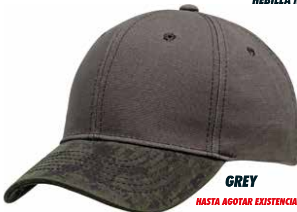
GREY HASTA AGOTAR EXISTENCIA