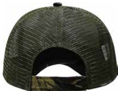
AJUSTADOR DE VELCRO