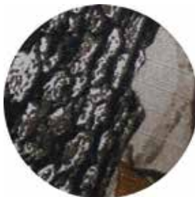
TELA DE POLIÉSTER SUBLIMADO