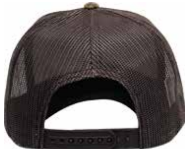
SNAPBACK DE PLÁSTICO