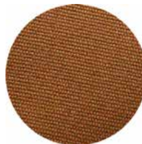
TELA DE ALGODÓN CANVAS