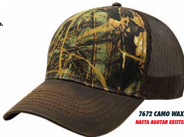
7672 CAMO WAXED