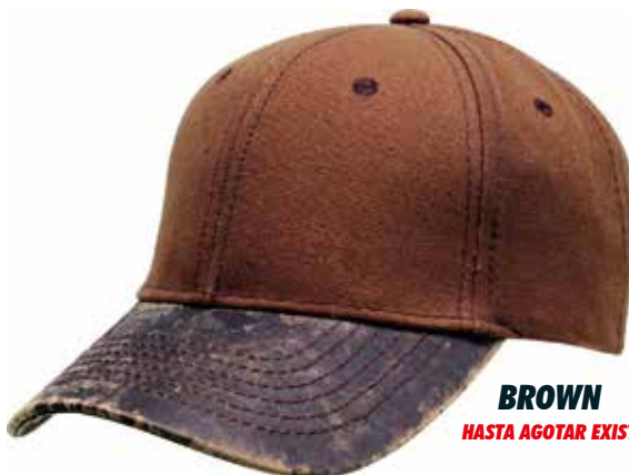
BROWN HASTA AGOTAR EXISTENCIA