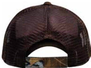
AJUSTADOR DE VELCRO