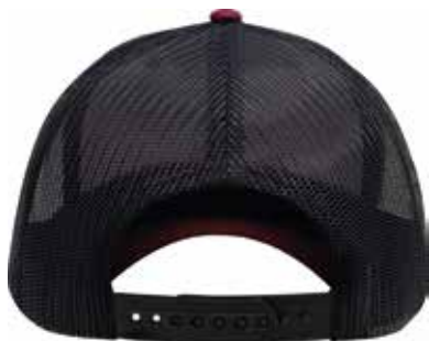
SNAPBACK DE PLÁSTICO