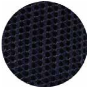
MALLA DE POLIÉSTER