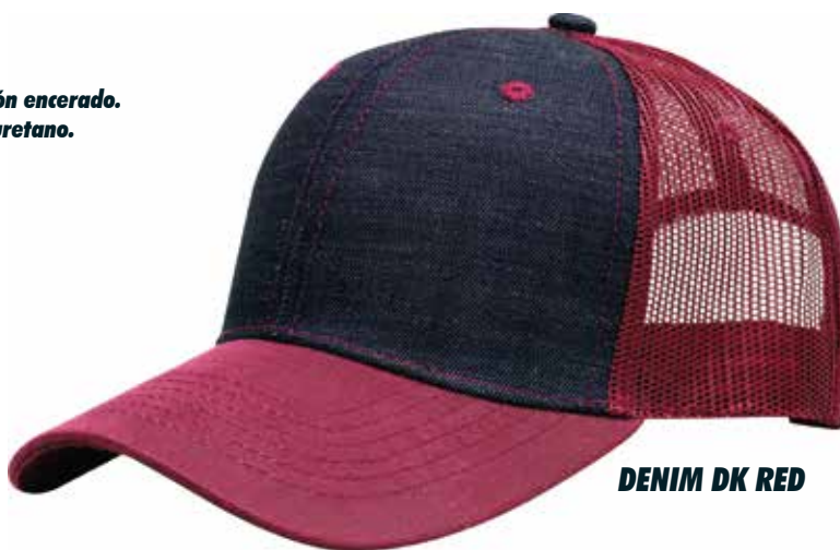
DENIM DK RED