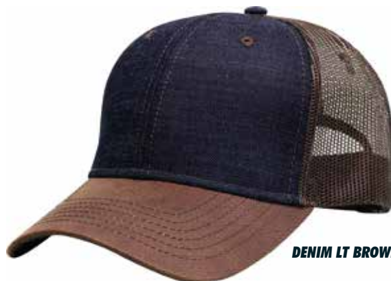
DENIM LT BROWN