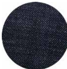
TELA DE MEZCLILLA