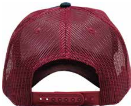
SNAPBACK DE PLÁSTICO