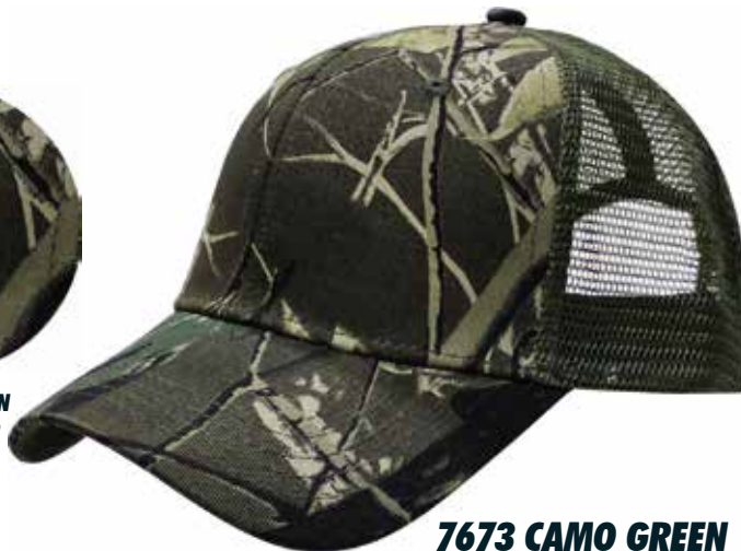
7673 CAMO GREEN