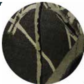
TELA DE ALGODÓN CON POLIÉSTER