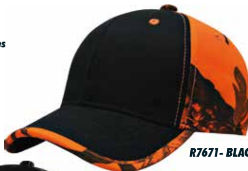
R7671- BLACK CAMO ORANGE