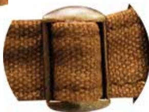
HEBILLA METÁLICA AJUSTABLE