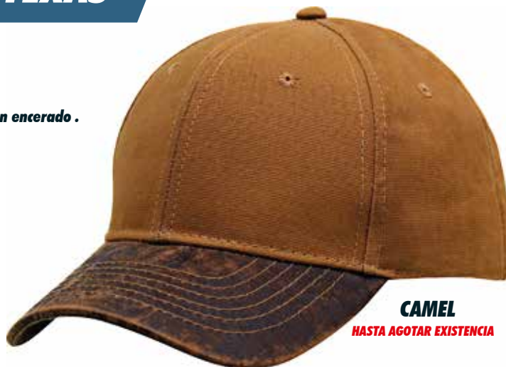
CAMEL HASTA AGOTAR EXISTENCIA