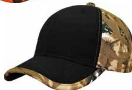
R7671- BLACK CAMO BROWN