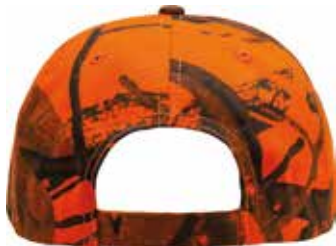
AJUSTADOR DE VELCRO