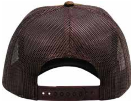
SNAPBACK DE PLÁSTICO.