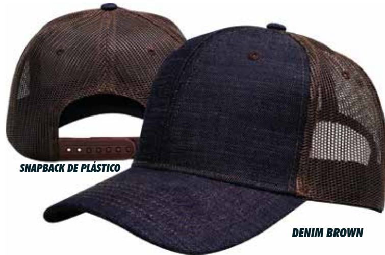
SNAPBACK DE PLÁSTICO