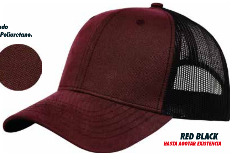
RED BLACK HASTA AGOTAR EXISTENCIA