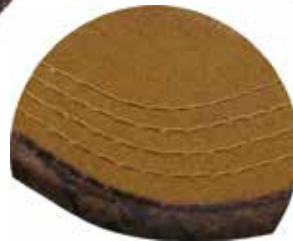
RIBETE EN VISERA EN ALGODÓN ENCERADO