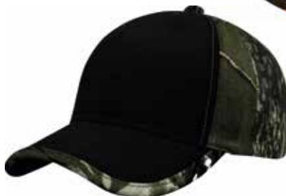
R7671- BLACK CAMO GREEN