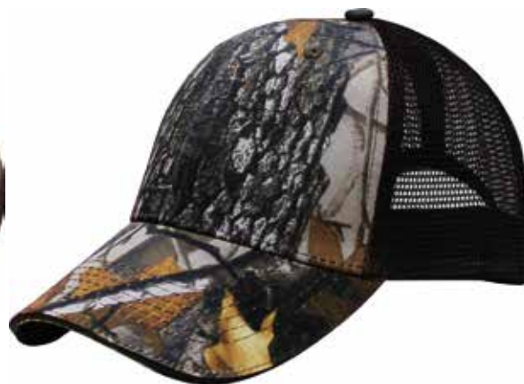
7674 CAMO BROWN