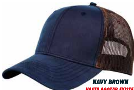
NAVY BROWN HASTA AGOTAR EXISTENCIA