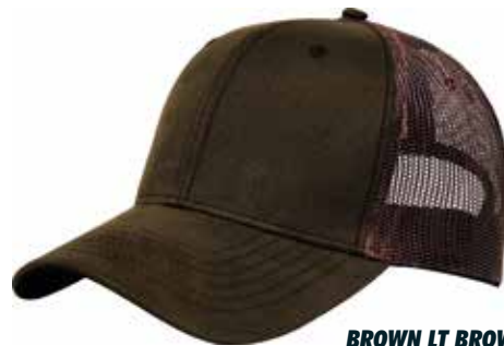
BROWN LT BROWN